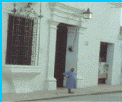
Casa de los hermanos Germán de Ribón Sede de la Casa de la Cultura

La casa de la Cultura de Mompox es una de las instituciones más representativas de la ciudad. En ella además de funcionar la Academia de Historia también tiene sede el Fondo Mixto para la promoción de la Cultura y las Artes de Bolívar y la Escuela de Teatro de Mompox.